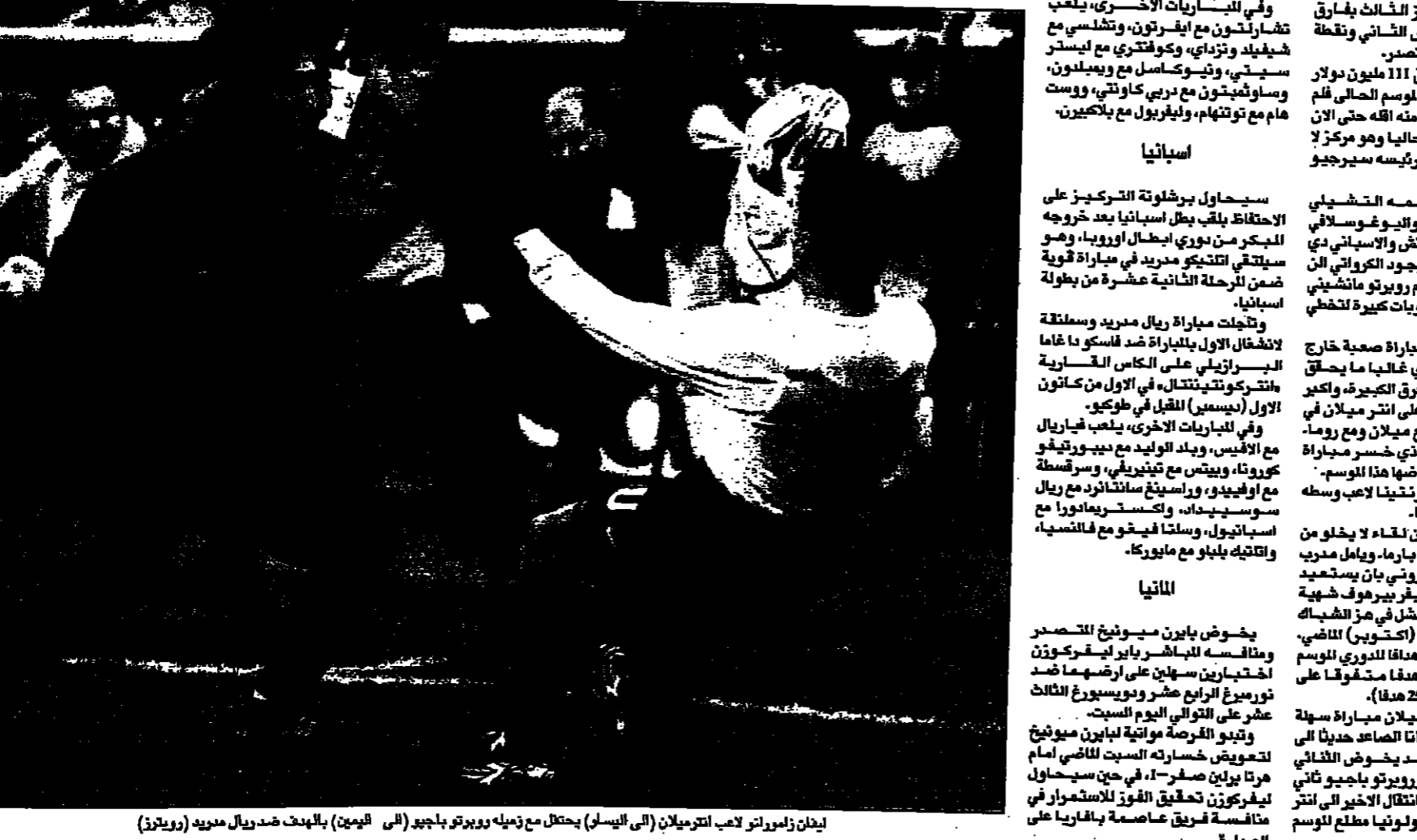
إيدان زاميرتو لاعب الترميلان (إلى اليسار) يحتفل مع زميله روبرتو باجو (إلى اليمين) بالهدف ضد ريال مدريد